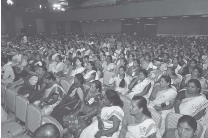
ദൃഷ്ടി - 2023 വനിതാ സംഗമത്തിൽ പങ്കെടുത്ത പ്രതിനിധികൾ

ചുടേറിയ ചർച്ചയായി മാറിയിരുന്നു. ഇതിനു തൊട്ടുമുമ്പാണ് ജോലിചെയ്തിട്ടും ശമ്പളം ലഭിക്കാത്തതിനെ തുടർന്ന് പ്രതിഷേധസൂചകമായി ബാഡ്ജ് ധരിച്ച് ജോലിചെയ്ത ജീവനക്കാരിയെ കെ.എസ്.ആർ.ടി.സി . ട്രാൻസ്ഫർ ചെയ്തുകൊണ്ടുള്ള ഉത്തരവിറങ്ങിയത്. ഇത്തരം സംഭവങ്ങൾ സ്ത്രീ സമൂഹത്തിൽ അരക്ഷിതത്വമുയർത്തിയ സാഹചര്യത്തിൽ അവരിൽ ആത്മവിശ്വാസം വളർത്താൻ ദൃഷ്ടി-2023 വനിതാ സംഗമത്തിന് സാധിച്ചു. ദൃഷ്ടി-2023 ലൂടെ ലഭിച്ച ആത്മവിശ്വാസം കേരളത്തിലെ സ്ത്രീതൊഴിലാളി സമൂഹത്തിന്റെ സേവനമേഖലകൾക്ക് ഗുണം ചെയ്യുമെന്നുറപ്പാണ്.