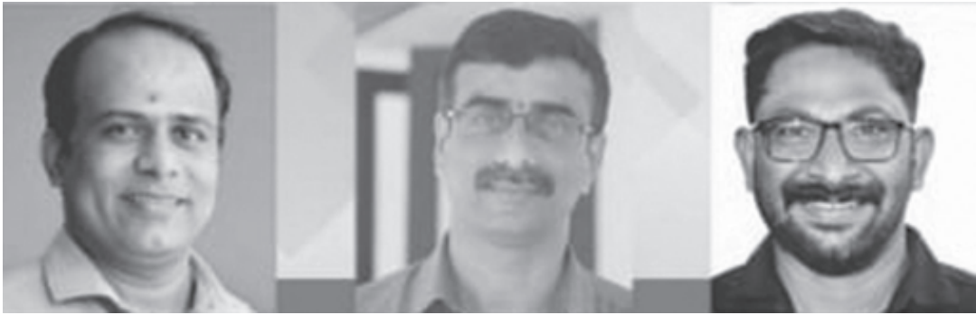
കെ. ഉപേന്ദ്രൻ പ്രസിഡന്റ്