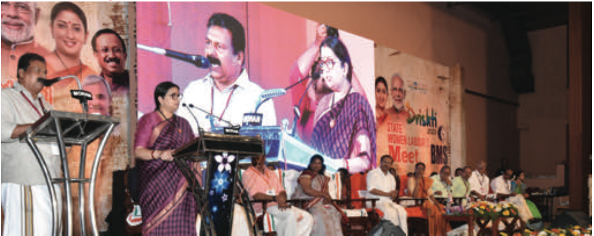
ദ്ദുഷ്ടി -2023 വനിതാ സംഗമം കേന്ദ്ര വനിതാ ശിശുക്ഷേമ വകുപ്പ് മന്ത്രി ശ്രീമതി സ്മൃതി ഇറാനി ഉദ്ഘാടനം ചെയ്യുന്നു.

തിരുവനന്തപുരം : വനിതാതൊഴിലാളികളുടെ അടിയന്തരാവശ്യങ്ങൾ ഉന്നയിച്ചുകൊണ്ട് വനിതകൾ തന്നെ സംഘടിപ്പിച്ച വനിതാ സമ്മേളനം. അതിൽ 3500 ലധികം വനിതകൾ പങ്കെടുത്തു. തിരുവനന്തപുരം കവടിയാറിലെ ഉദയ് പാലസിൽ സംഘടിപ്പിച്ച വനിതാസംഗമം ശ്രദ്ധേയമായത് അതിന്റെ ഇത്തരം സവിശേഷതകൾകൊണ്ടായിരുന്നു. ഈ സംഗമത്തിൽ മുഖ്യാതിഥി കേന്ദ്ര വനിതാ ശിശുക്ഷേമ വകുപ്പ് മന്ത്രി സ്മൃതി ഇറാനിയായിരുന്നു.