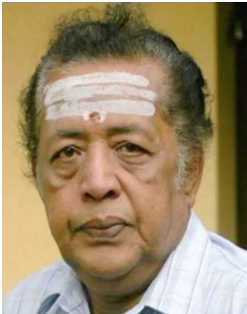
പുജപ്പുര രവി പ്രശസ്ത മലയാളം നാടക സിനിമാ നടൻ.