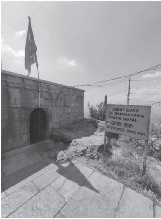
ശ്രീ ശങ്കരാചാര്യ പീഠം

1846 മാർച്ച് 16ന് ജമ്മുകാശ്മീർ രാജാവ് ഹരിസിംഗും ബ്രിട്ടീഷ് ഈസ്റ്റ് ഇന്ത്യാ കമ്പനിയുമായി ചേർന്ന് ഒപ്പുവെച്ച കരാർപ്രകാരം 75 ലക്ഷം രൂപയും വാർഷിക കപ്പമായി ഒരു കുതിരയും 6 മുട്ടനാടും രണ്ട് ജോടി കാശ്മീർ ഷാളും നൽകാമെന്ന വ്യവസ്ഥയിൽ, 5000 വർഷങ്ങൾക്കുമുമ്പ് ജംബുലോചൻ നിർമ്മിച്ച ജമ്മു അടങ്ങുന്ന ജമ്മുകാശ്മീർ എന്ന നന്ദനോദ്യാനം ഹിന്ദു രാജാവിന്റെ ഭരണത്തിൻ കീഴിലായി. കുർത്തയും ചൂണിയും പൈ ജാമയും ധരിച്ച പഞ്ചാബിത്തരുണികൾ കൂസലില്ലാതെ കിന്നാരംപറഞ്ഞ് പൊട്ടിച്ചിരിച്ച് പരിമളം പരത്തി സഞ്ചരിക്കുന്ന മോഹനമായ ലാഹോറിലെ അനാർക്കലിത്തെരുവിനെക്കുറിച്ച് എസ്.കെ. പൊറ്റക്കാട് തന്റെ സഞ്ചാരസാഹിത്യത്തിൽ കുറിച്ചിട്ടുണ്ട്. ഹിമവാന്റെ കടാക്ഷ വലയത്തിൽപ്പെട്ട കാടുകളും വനാന്തരങ്ങളും മഞ്ഞണിഞ്ഞ കൊടുമുടികളും ജലാശയങ്ങളും ഉദ്യാനങ്ങളും ആപ്പിൾ തോട്ടങ്ങളും ഒക്കെചേർന്ന ഭൂമിയിലെ സ്വർഗ്ഗമായിരുന്ന കാശ്മീർ താഴ്വരയെ ചെങ്കുത്താന്റെ വാസസ്ഥാനമാക്കി പ്രേതഭൂമിയായി മാറ്റിയിട്ട് പതിറ്റാണ്ടുകളായി. 1947 ആഗസ്റ്റ് 15ന് ഭാരതം സ്വാതന്ത്ര്യം നേടുമ്പോൾ